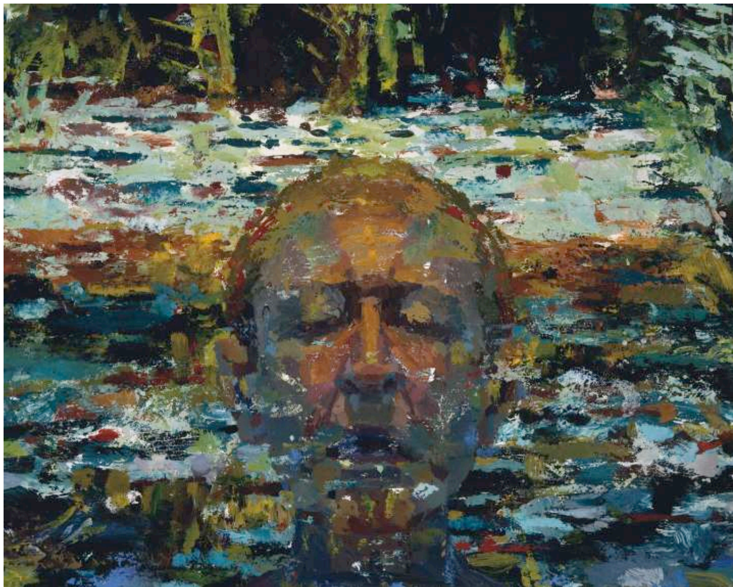
Water Years I 31X38cm oil on linen, 2005