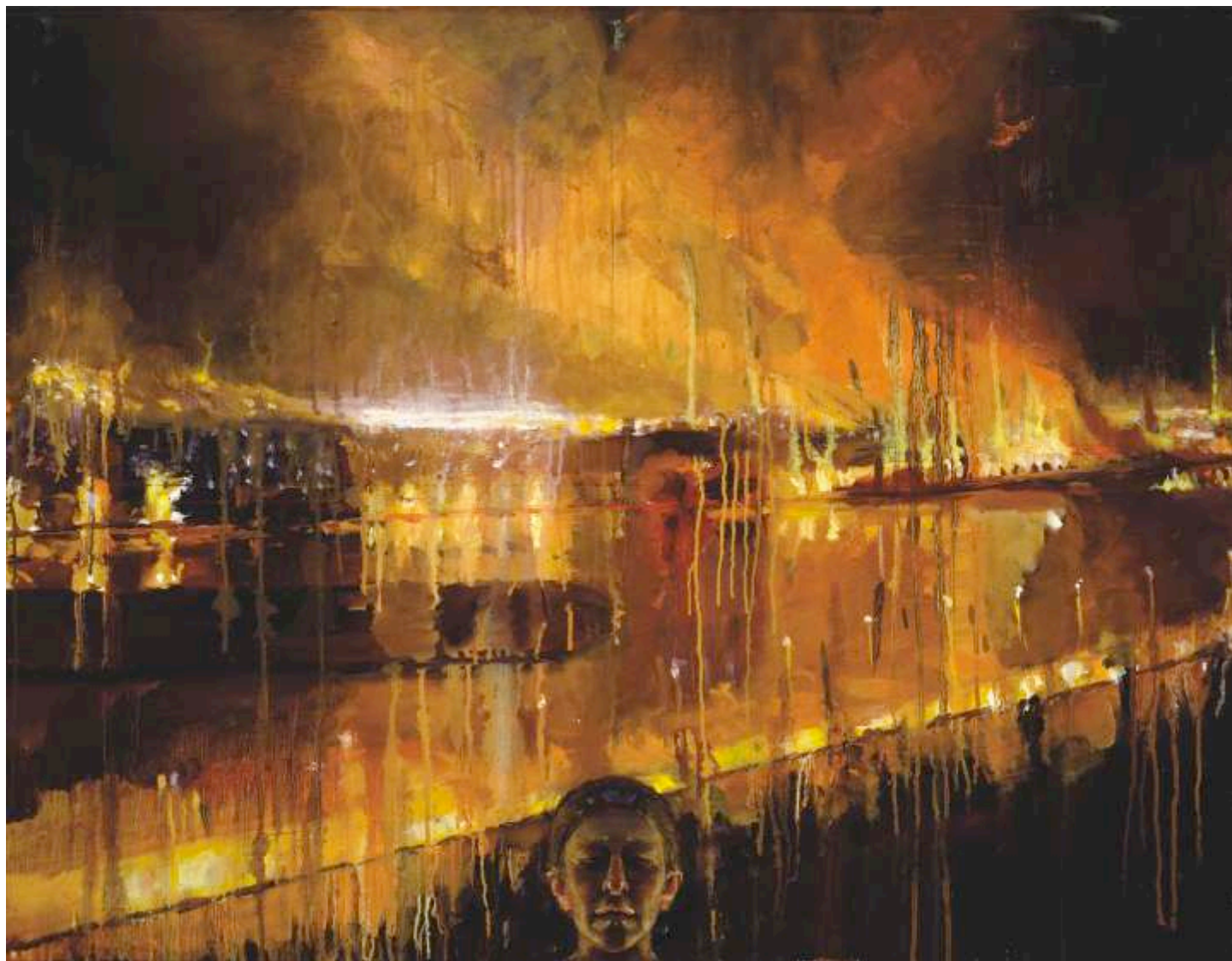
Valent 71X92cm oil on linen, 2004